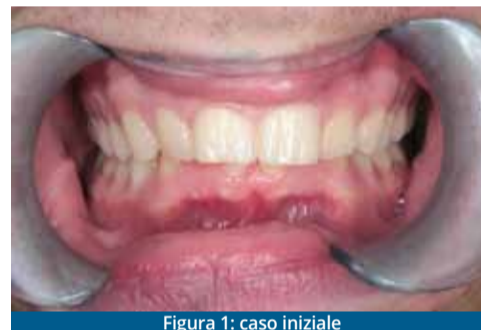
Figura 1: caso iniziale