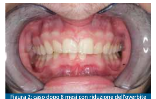
Figura 2: caso dopo 8 mesi con riduzione dell'overbite